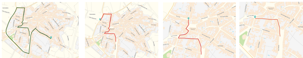
Recorrido SUB 14/16 Recorrido SUB12 Recorrido SUB10 Recorrido SUB8